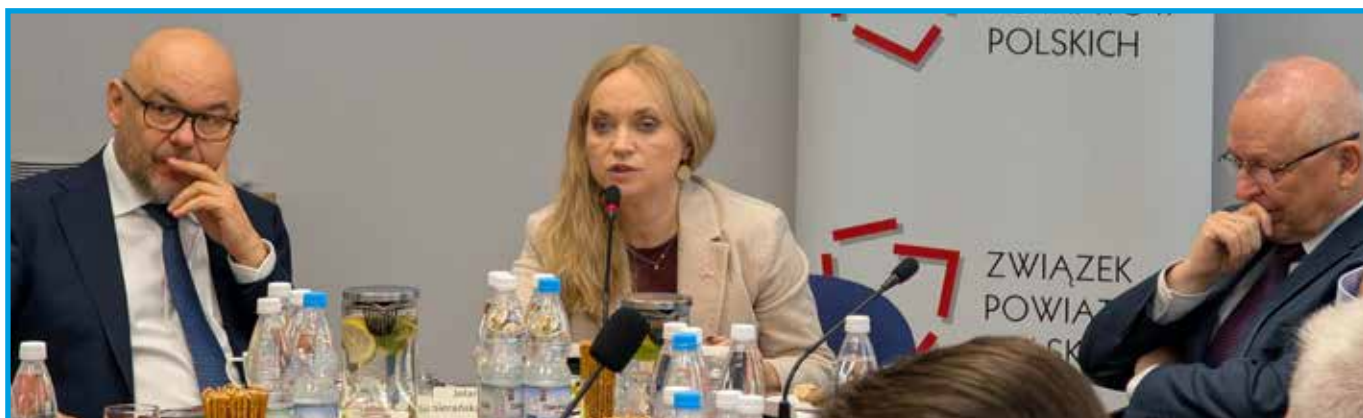
W trakcie dyskusji z Minister Zdrowia Jolantą Sobierańską-Grendą